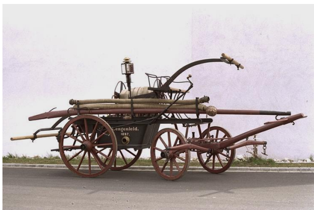
Handdruckspritze aus Lengenfeld

Jahrhunderte lang nahmen die Bewohner in ihrer Ortschaft das Feuerlöschwesen selbst in die Hand. Viele waren zum Löschdienst verpflichtet. Die Brandbekämpfung gelang aber eher schlecht als recht. Viele Städte brannten oft mehrmals ab. Es entstanden Feuerlöschordnungen und Feuerwehren. Auch in Marktredwitz bemühte man sich, das Löschwesen ständig zu verbessern. Ausrüstungsgegenstände, die viele Jahre den Einsatz überstanden, kann man heute im Marktredwitzer Feuerwehrmuseum betrachten.