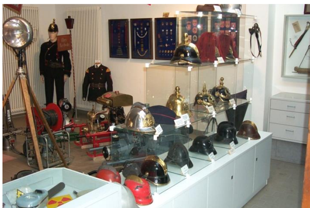
Feuerwehrhelme Ende des 19. Jahrhunderts

In vielen Jahren gesammelt und restauriert, spiegeln sie die Entwicklung der Einsatzmöglichkeiten der letzten 150 Jahre wieder.