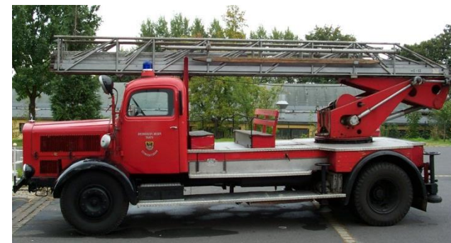
Drehleiter DL 22, Baujahr 1941

Neben den historischen Geräten im Feuerwehrmuseum verfügt die Freiwillige Feuerwehr Marktredwitz über ein Löschgruppenfahrzeug LF 15 und eine Drehleiter DL 22 aus den 40er Jahren des letzten Jahrhunderts. Beide Fahrzeuge stehen nicht in den Räumen des Museums, können allerdings nach Vorabsprache besichtigt werden.