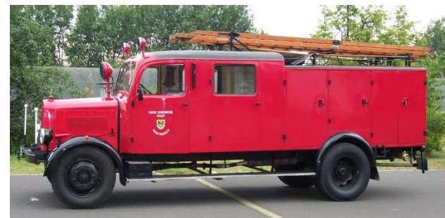
Löschgruppenfahrzeug LF 15, Baujahr 1943

In fachmännischer Handarbeit wurden die Ausstellungsstücke detailgetreu wieder in ihren ursprünglichen Zustand versetzt.